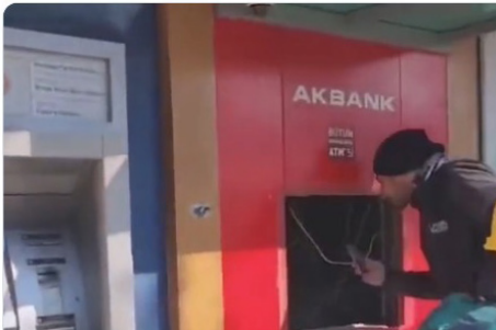
Antakya'da banka ATM'leri yağmalandı.