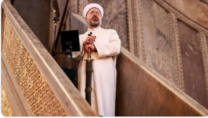
Ös 1:17 - 12 May 2023 - 703,8 B Görüntülenme

Aile yapımız sarsıldığında millet varlığımızı devam ettirmemiz mümkün değildir. Öyleyse, dünyadaki cennetimiz olan ailemizin kıymetini bilelim; aile yapımızı tehdit eden her türlü zararlı akım karşısında uyanık olalım!"