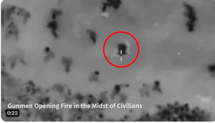
Gunmen Opening Fire in the Midst of Civilians