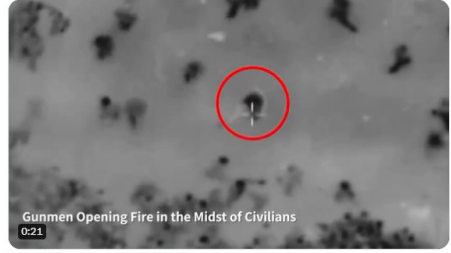
Gunmen Opening Fire in the Midst of Civilians