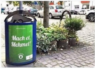
Ös 102 - 19 May 2024 - L4 Mm Görüntüleme