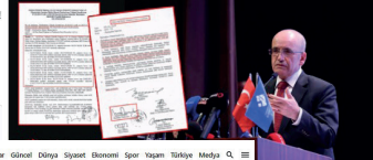
Foto Galeri Video Galeri Yazılar Güncel Dünya Sıyaset Ekonomi Spor Tazir Türkiye Medya

• 10 Temmuz 2024 / 10:26 • Düzeltmeler: 10 Temmuz 2024 / 10:47 • Güldem Akbaş